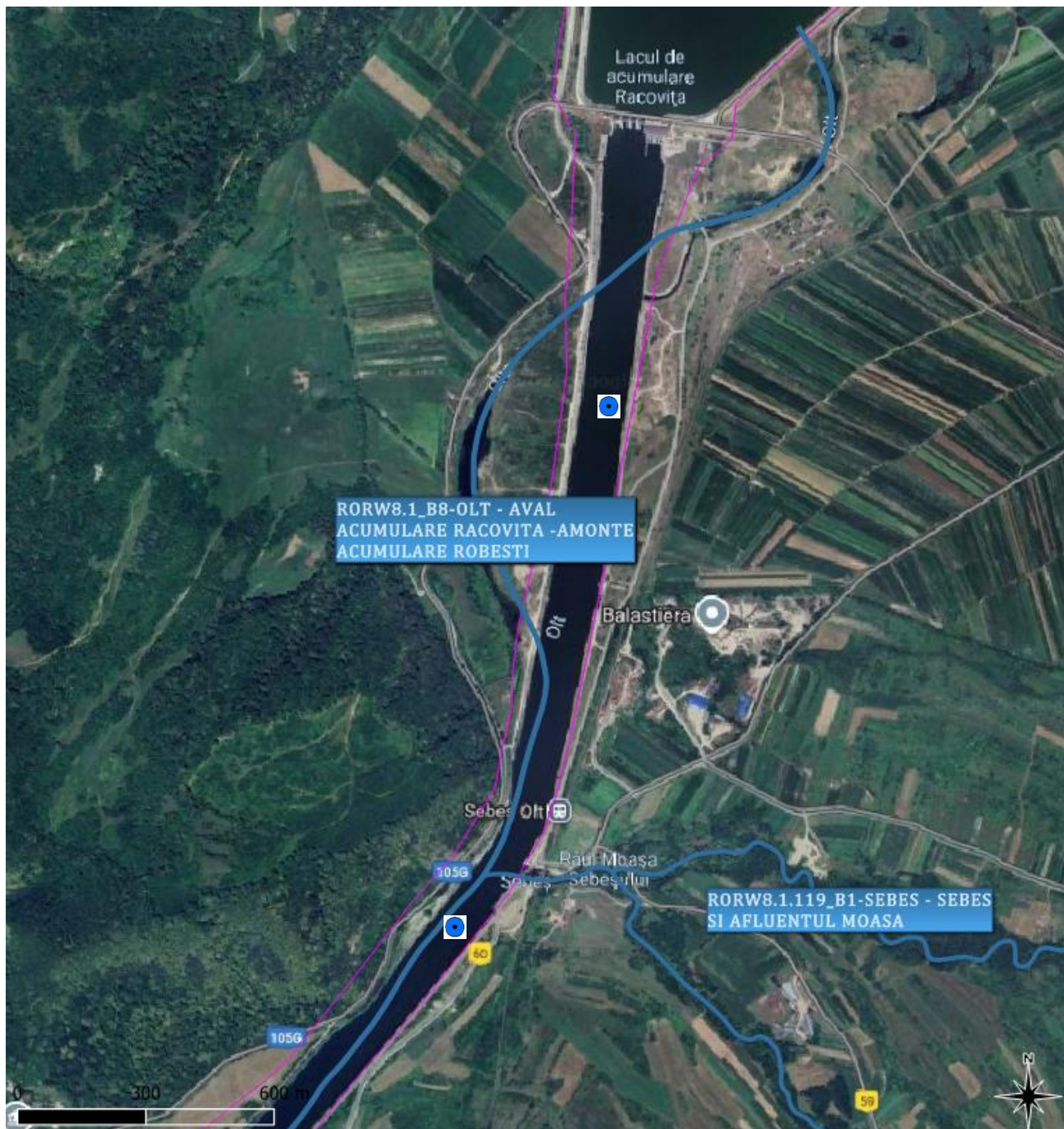
Figura 1. Locația secțiunilor de monitorizare: Amonte confluență SEBEȘ - Sebeș și afluentul Moașa (RORW8-1-119_B1) (aval CHE RACOVITA) și Aval confluență SEBEȘ - Sebeș și afluentul Moașa (RORW8-1-119_B1)

proapse pe corpul de apă OLT - aval acumulare Racovița - amonte acumulare Robești (RORW8-1_B8)