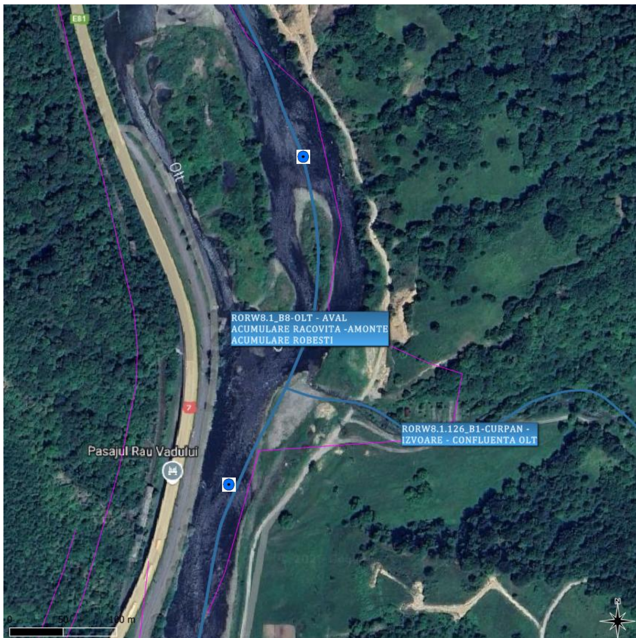
Figura 7. Locația secțiunilor de monitorizare: Amonte confluență CURPAN(RORW8-1-126_B1) și Aval confluență Vad și afluentul Iacob (RORW8-1-125_B1)