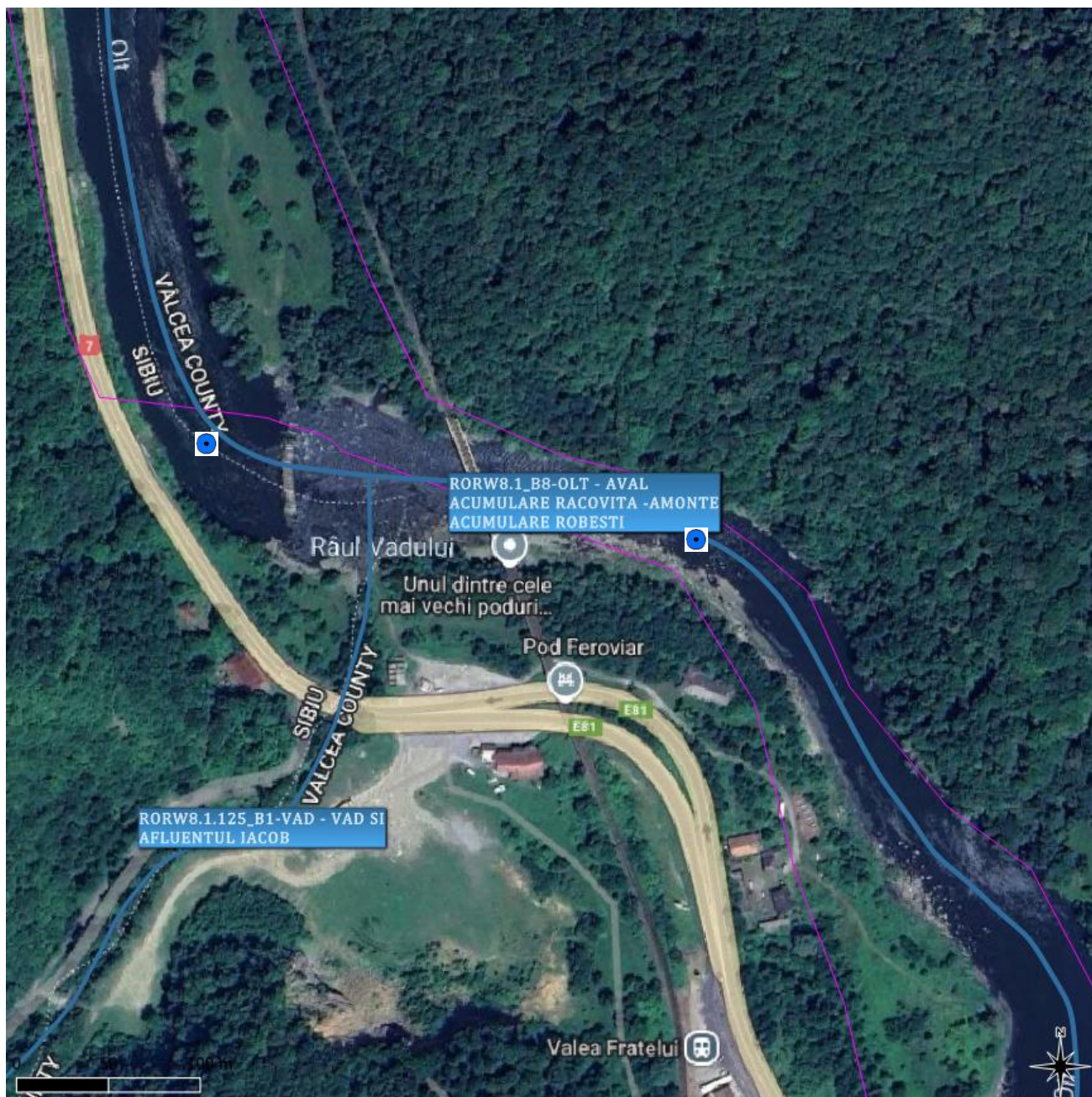
Figura 6. Locația secțiunilor de monitorizare: Amonte confluență Vad și afluentul Iacob (RORW8-1-125_B1) și Aval confluență Vad și afluentul Iacob (RORW8-1-125_B1)