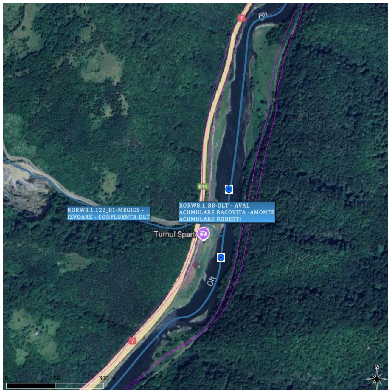
Figura 4. Locația secțiunilor de monitorizare: Amonte confluență MEGIES (RORW8-1-122_B1) și Aval confluență MEGIES