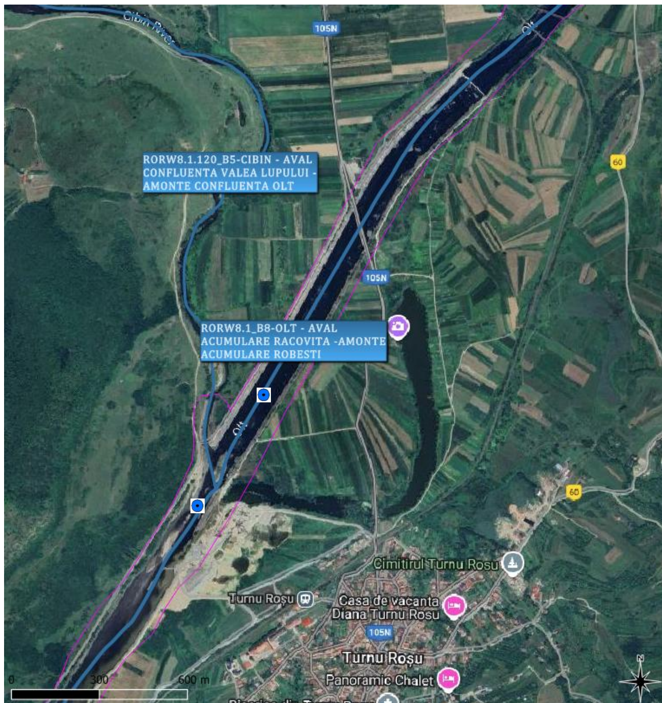
Figura 2. Locația secțiunilor de monitorizare: Amonte confluență CIBIN (RORW8-1-120_B5) și Aval confluență CIBIN