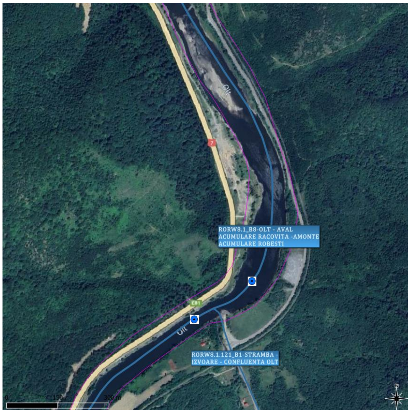
Figura 3. Locația secțiunilor de monitorizare: Amonte confluență STRÂMBĂ (RORW8-1-121_B1) și Aval confluență STRÂMBĂ