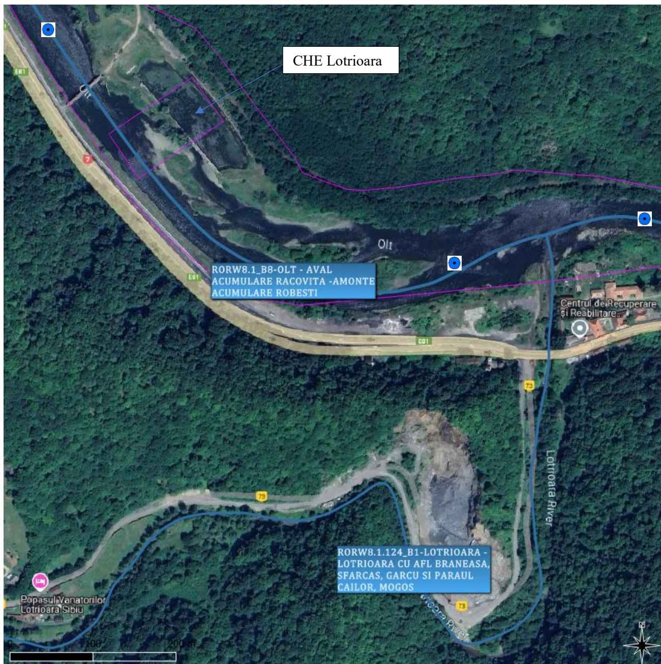
Figura 5. Locația secțiunilor de monitorizare: • Amonte CHE Lotrioara, Amonte confluență LOTRIOARA (RORW8-1-124_B1) (aval CHE Lotrioara) și Aval confluență LOTRIOARA (RORW8-1-124_B1),